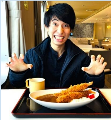
↑さるびあ丸の食堂にて

あっという間の1年間でしたが、利島の皆様には本当に大変お世話になりました。診療だけでなく、日々の交流や歴史、暮らしに触れる中で、島の外では得られない多くの学びをいただきました。