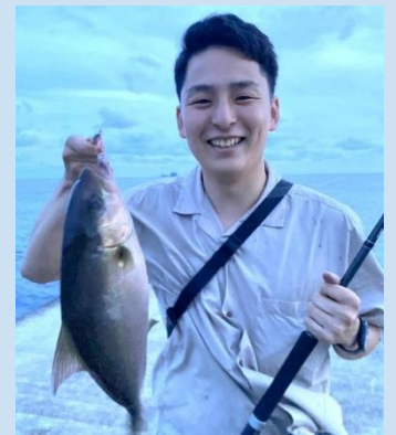
↑カンパチ釣りの時の様子